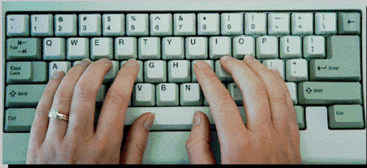
Home Row Finger Positions

Try it ... place your fingers in the Home Row position on your keyboard.